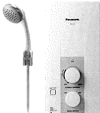
PANASONIC เครื่องทำน้ำอุ่น DH-3JL2TH